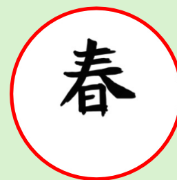
Lente, Chinees Schrift

Wat ik niet begrijp is waar de lente blijft. Laat maar komen zou ik zeggen. En daarna, na ook nog weer een heerlijke zomer, uitkijken en verlangen naar z'n echte winter, het volgend jaar. Maar niet weer z'n chagrijnige periode als we hopelijk inmiddels achter ons hebben.